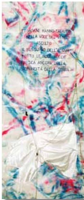
Eleonora Del Brocco Il sussurro dell'acqua