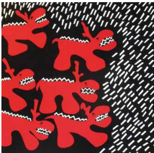
Fabio Petrassi Concerto sotto la pioggia