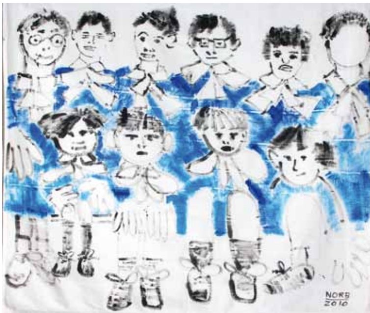
Norberto Cenci Foto di classe