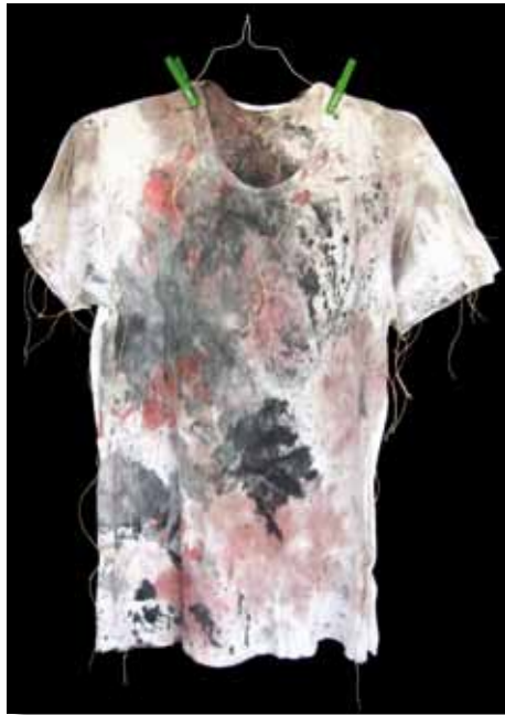
Donata Buccioli Doppio bucato