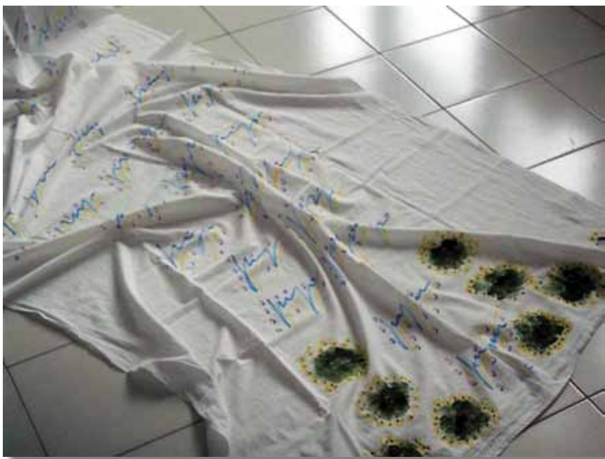
Tomaso Binga Scorie fiorite