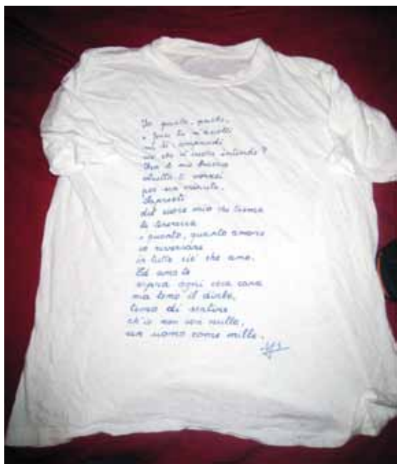
Domenico Sacco Adolescenza d'amore