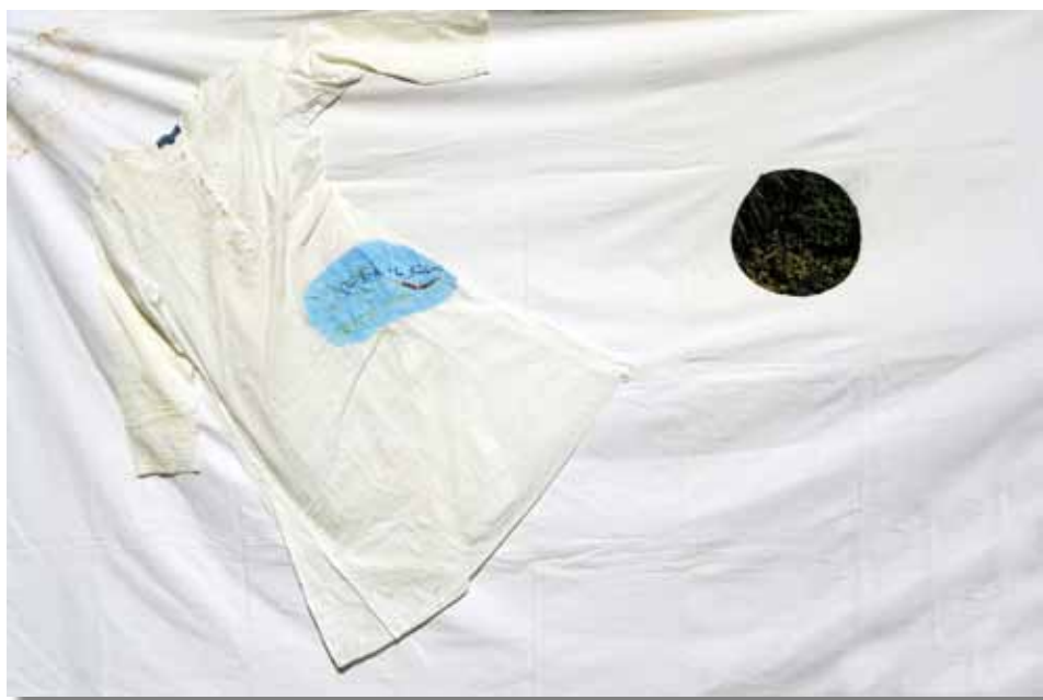
Simona Sarti Notte stellata