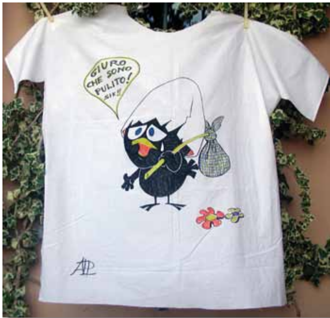
Annalisa Pagni No clandestinit  = reato