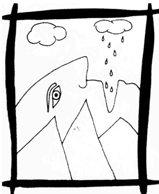
Giorgio Fiume Pioggio filosofale n. 2