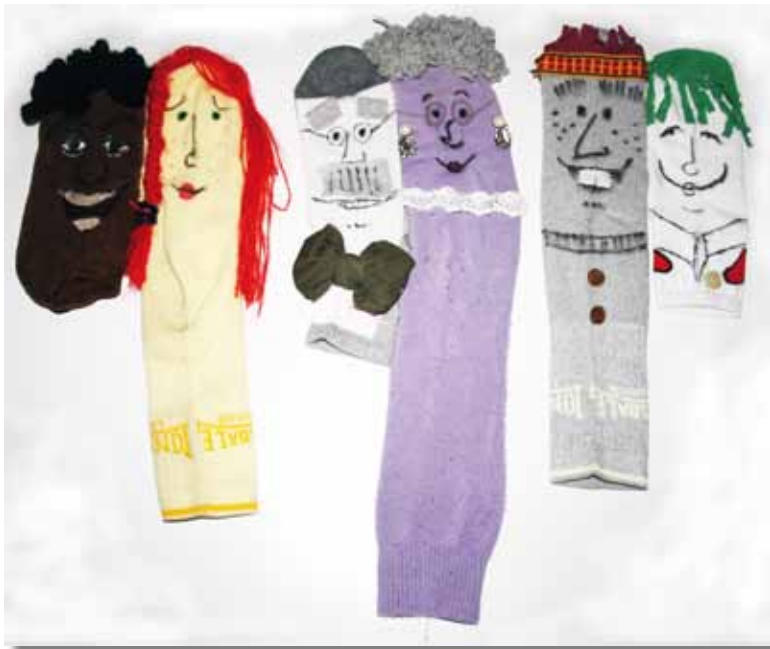
Giulia Carioti Rivincita