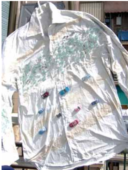
Stefania Di Lino On the road