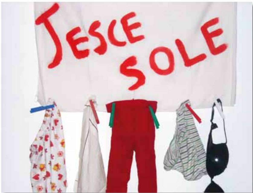
Fausta Finazzo Sole Jesce