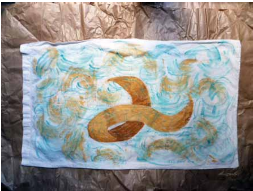
Elvi Ratti Sogni d'oro